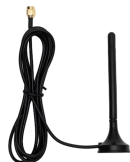
2米吸盘天线-4G (可选配机柜天线, 胶棒天线等)