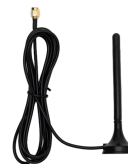
2米吸盘天线-4G (可选配机柜天线, 胶棒天线等)